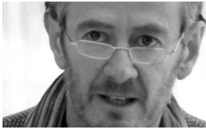
por José Aylwin

Los sectores étnica y culturalmente diferenciados en Chile, representados por los pueblos originarios, y en forma creciente, por la población de origen indígena y afrodescendiente proveniente de otros países de la región, han estado históricamente excluidos de las esferas de decisión, incluyendo tanto la esfera pública como la privada. Los déficits que en esta materia tuvieron los gobiernos de la Concertación son manifiestos. Donde la participación de los pueblos originarios en las instancias de decisión pública -ejecutivo, legislativo y judicial-, más allá de aquellas instancias encargadas de las políticas sectoriales que les concierne, fue prácticamente nula.